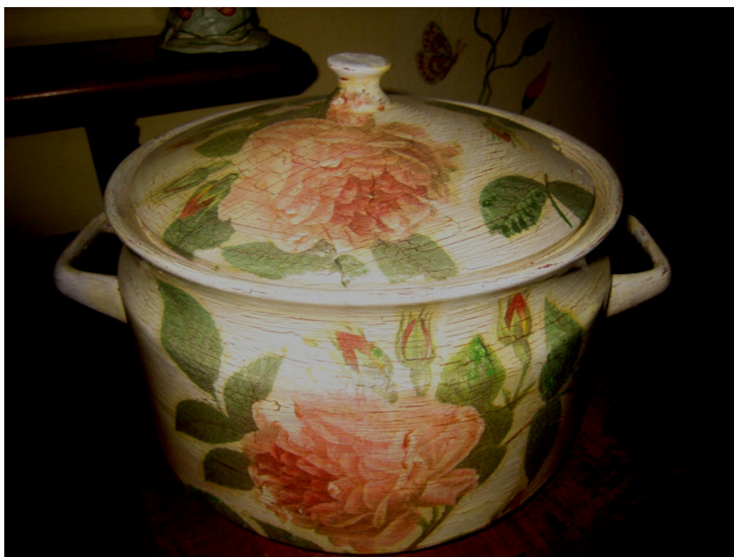
Vecchia Zuppiera decorata a craquelé.

In pratica ogni Craquelè è una sorpresa.