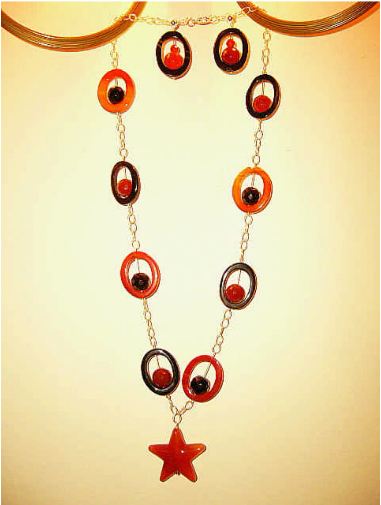
Collana in argento, corniola e agata nera