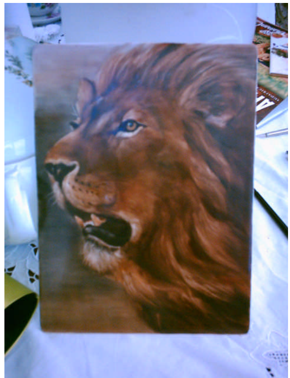
Leone ripassato per la seconda cottura