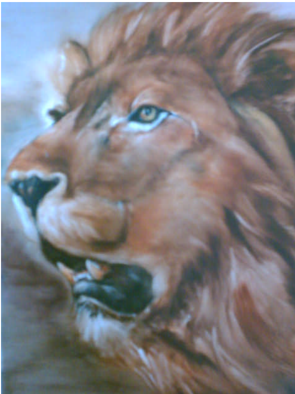
Leone dopo prima cottura